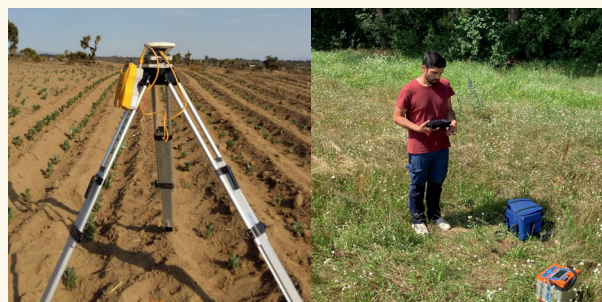
Das linke Bild zeigt eine GPS Messung, © Cornejo, KIT. Rechts wird eine Gravimetrie-Messung durchgeführt, © Schätzler, KIT.

Alle Messpunkte werden mit einem GPS (engl.: global positioning system) mit hoher Messgenauigkeit eingemessen. Dies ermöglicht eine präzise Bestimmung der Positionen und trägt zur verbesserten Interpretation aller weiteren Messdaten bei. Die Gravimetrie misst Änderungen im Schwerefeld der Erde, die durch Dichteunterschiede im Untergrund verursacht werden. Ein Gravimeter wird auf der Erdoberfläche platziert und erfasst minimale Änderungen der Schwerkraft. Durch die Kombination von Gravimetrie und GPS lassen sich detaillierte Karten der Dichteverteilung im Untergrund erstellen.