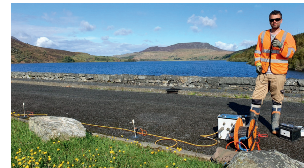
Typischer Aufbau einer Geoelektrik-Messung mit den installierten Elektroden samt verbindender Kabel, ©Terradat (UK) Limited.

Die folgende Abbildung zeigt einen typischen Aufbau einer geoelektrischen Messung, bei der die Elektroden über ein Kabel mit einer Messeinheit verbunden sind. Als Elektroden dienen Edelstahlspieße, die in regelmäßigen Abständen entlang des Profils von Hand einige Zentimeter tief in den Boden gesteckt werden. Der gesamte Messablauf wird über eine Software gesteuert.